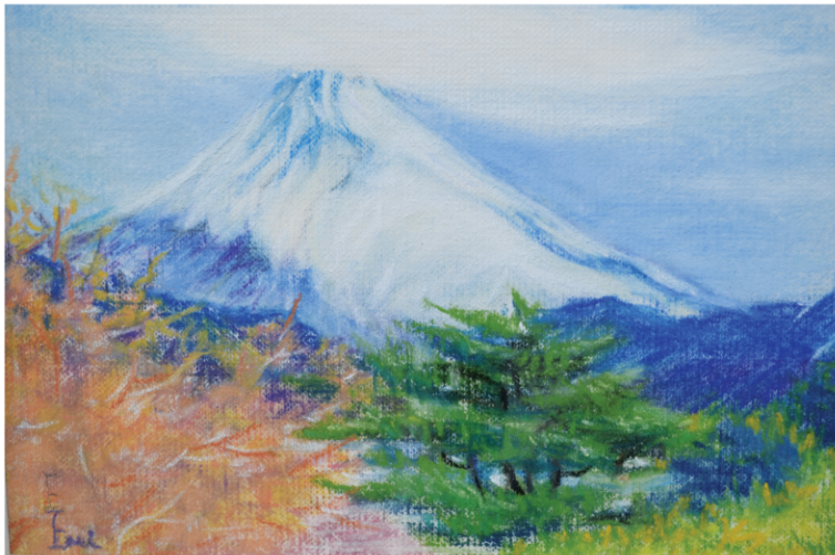
伊東・吉田より望む富士山／三井恵美子・画