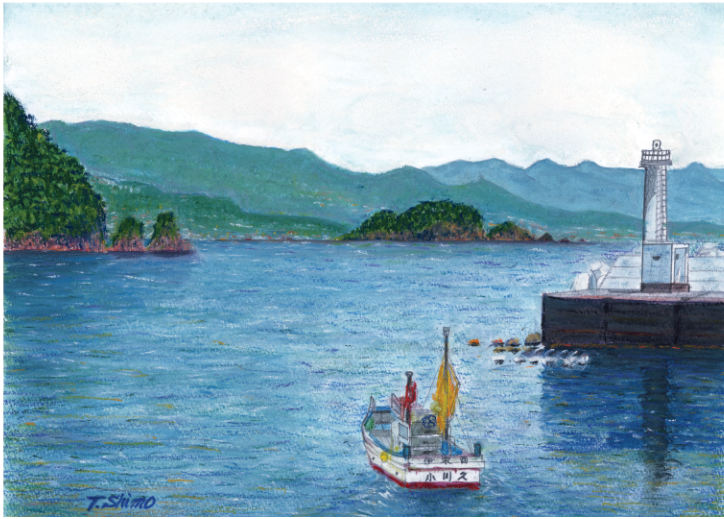
夏の川奈港/下村俊宏・画