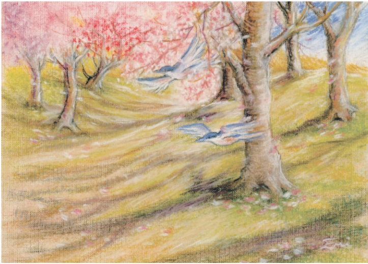
桜の里／三井恵美子・画