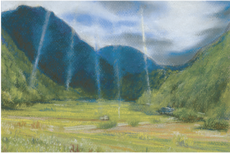
夕立ち前の池の里／三井恵美子・画